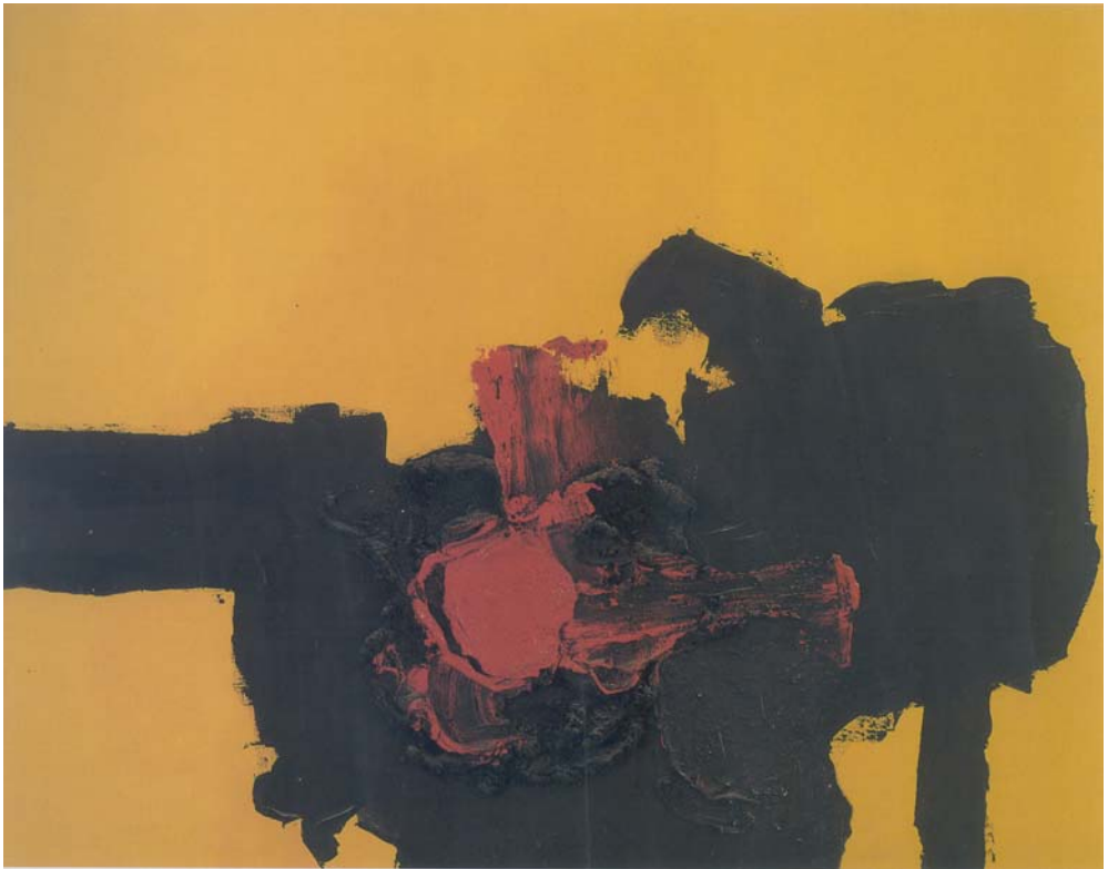
Número 460-A, 1963