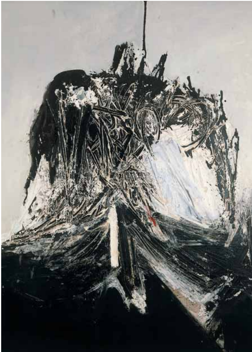
Toledo, 1960 250 cm x 200 cm